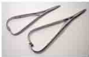
02.02.0510 PINÇA DISSECAÇÃO 18 CM 02.02.0511 PINÇA DISSECAÇÃO 20 CM