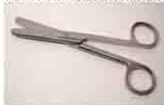
02.02.0555 TESOURA CIRURGICA CURVA PONTA ROMBA-FINA 17 CM