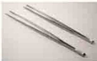
02.02.0505 PINÇA DENTE DE RATO 18 CM 02.02.0506 PINÇA DENTE DE RATO 20 CM