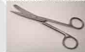
02.02.0556 TESOURA CIRURGICA CURVA PONTA ROMBA-ROMBA 17 CM