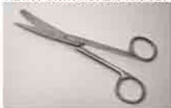
02.02.0551 TESOURA CIRURGICA RETA PONTA ROMBA-ROMBA 17 CM